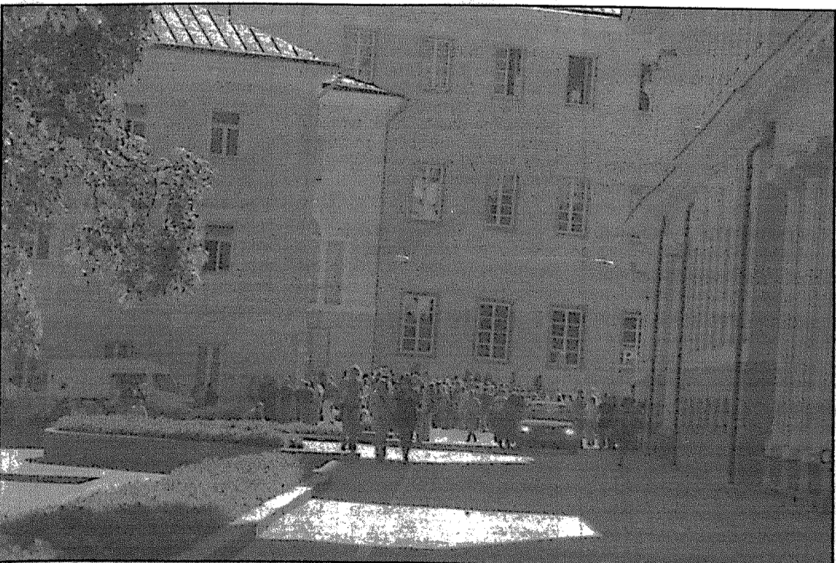
Mokslotyros metų atidarymo šventė Vilniaus universitete